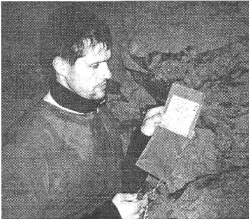
Speleologai urvų dugnuose palieka lenteles su savo pavardėmis.

Daugeliui tai gali pasirodyti savęs kankinimas, tačiau jiems, speleologams, tai yra didžiausias malonumas. Juos vilioja ne tik žemės gelmėse stypintys neįprasti gamtos stebuklai, sukurti iš vandens ir uolų. Jiems kur kas idomiiau įveikti save, o išlipus iš urvo, vėl atrasti, koks nuostabus ir spalvingas yra pasaulis.