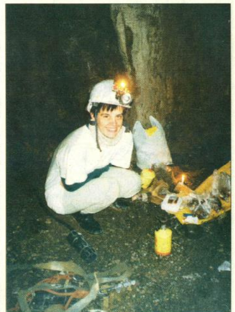
„Urvė lyg išsivalai, geriau pažįsti save. Ten turi vienintelį tikslą – išgyventi.“

Mergaitė labai mėgsta laipioti durų stalakte įtaisais specialiais kabliais.