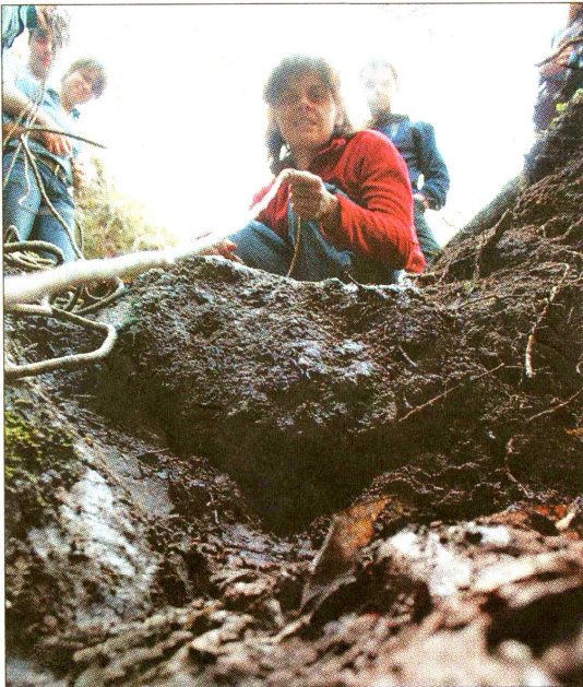
Likusieji ant kranto skaičiuoja nerimo minutes