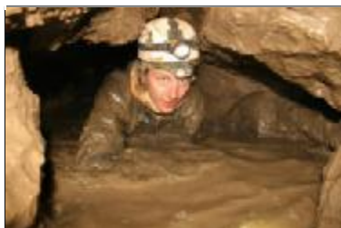
Viena lietuvių speleologų komanda po žeme praleido 36 valandas.